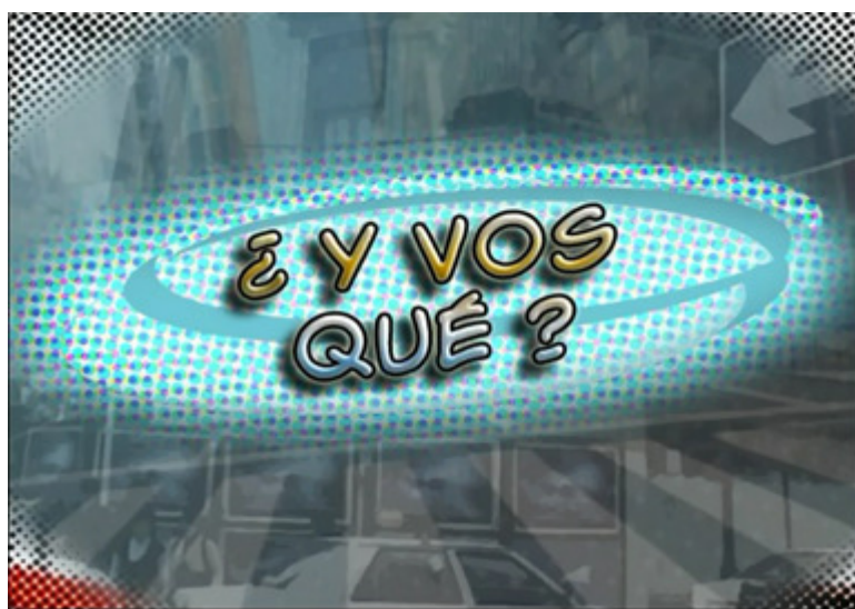
El video fue elaborado por la OA para fomentar el debate sobre valores éticos.

La Oficina Anticorrupción del Municipio de Morón, en el marco de la reunión del Foro de Fiscalías y Oficinas Anticorrupción realizado en Mar del Plata, anunció la inclusión de los materiales de Y vos qué? -un video y una guía docente elaborados por la Oficina Anticorrupción (OA) para fomentar entre los jóvenes el debate sobre valores éticos- en una bolsa pedagógica que será distribuida junto con otras publicaciones relacionadas con el acceso a la información pública en todas las escuelas secundarias de su jurisdicción.