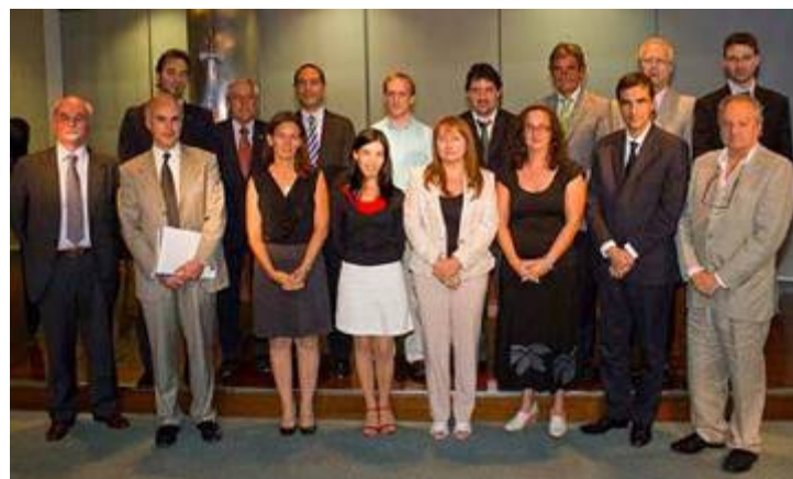
Se presentaron los nuevos integrantes de la Mesa Directiva del Pacto Global

La Oficina Anticorrupción (OA) participó como invitada especial en la Tercera Asamblea Nacional de la Red Argentina del Pacto Global de Naciones Unidas, que se desarrolló el 22 de noviembre. La OA no es miembro de la Red, pero colabora activamente con ella a través del PNUD.