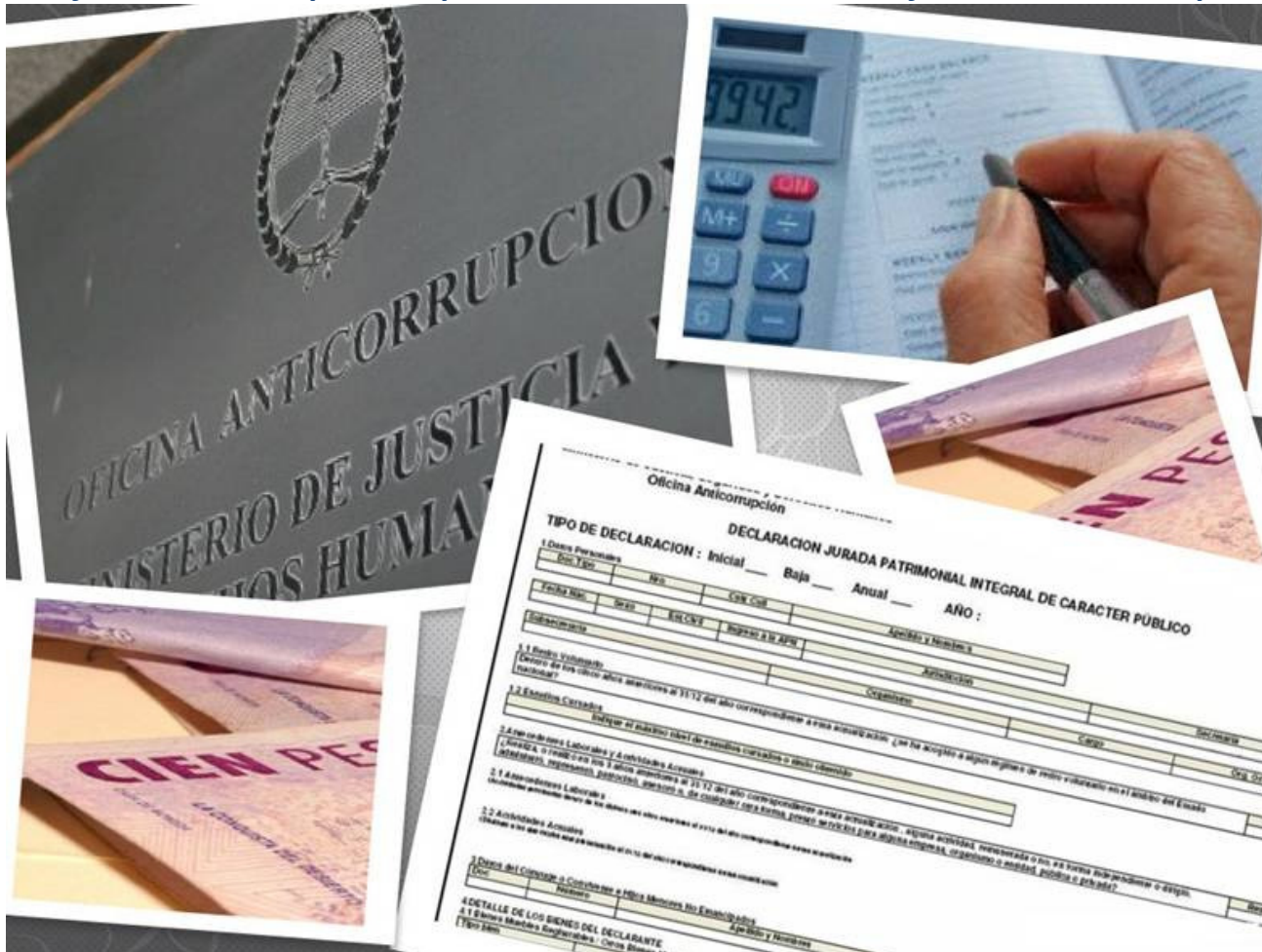
La firma de la resolución permite llevar a la práctica la retención de haberes