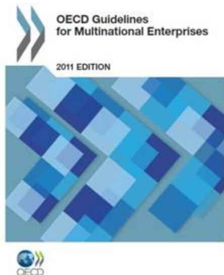
Las Directrices de la OCDE se aplican a partir de este mes

Durante noviembre la Oficina Anticorrupción (OA) continuó profundizando el trabajo vinculado a integridad y transparencia junto al sector privado.