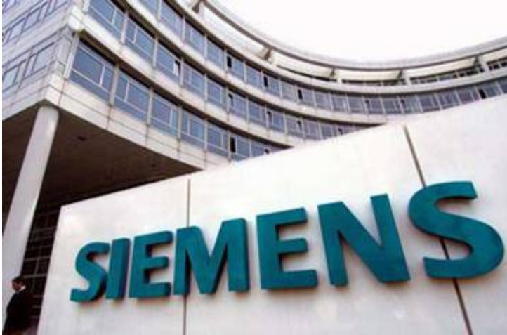
Los sobornos pagados por la empresa serían de más de 100 millones de dólares.

La Oficina Anticorrupción (OA) presentó el 14 de diciembre un escrito pidiendo que se envíe un exhorto a Estados Unidos para que la Justicia de dicho país remita copia de la documentación de la causa donde se investiga el pago de sobornos por parte de directivos de la empresa Siemens a funcionarios argentinos para conseguir el contrato para hacer documentos.